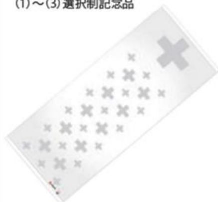
今治産無撚糸フェイスタオル