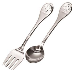
燕産スプーン&フォーク