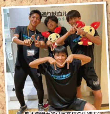
熊本学園大学付属高校の生徒さん 探究活動として献血について 学びにきてくれました!(^^)! 最後はみんなで献血も!★