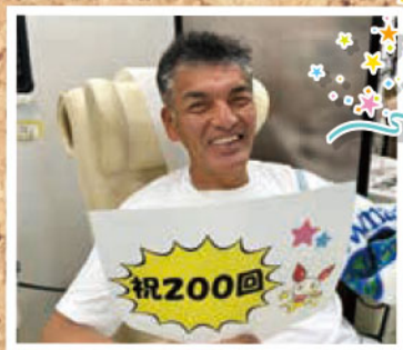
祝200回目の献血でした!!! いつもありがとうございます★