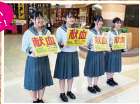
@献血バス (会場ゆめタウン八代)