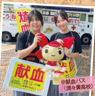
@献血バス (済々黌高校)