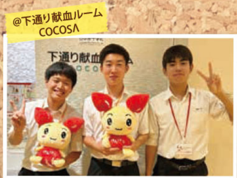
@下通り献血ルーム COCOSA