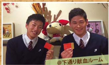
@下通り献血ルーム