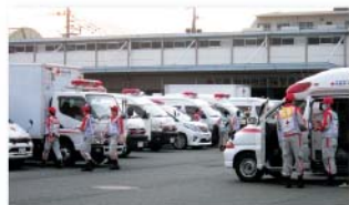
全国から参集した赤十字の救護員

しかし、震災の影響により、地域によっては企業、団体等のご協力による献血が難しくなっていることから、献血者の皆様には、 年間を通した継続的な献血へのご協力 をいただきますようお願いいたします。