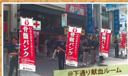
@下通り献血ルーム