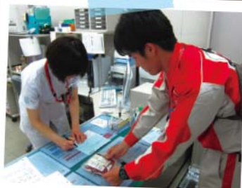
医療機関へ手分けして輸血用血液を供給(熊本市内医療機関)

現地では慣れない環境下での活動が続きましたが、熊本センターの方とコミュニケーションをとり、情報共有や作業の効率化を図りながら業務に取り組むことができたと思ひます。今回の活動を通して、道路の寸断などによる配送の難しさもありながら、いかなる時にも迅速かつ確実に血液を患者さんへ届けることの重要性を改めて感じました。