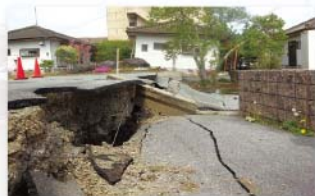
地割れて大きな段差が出来た道路