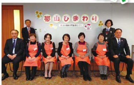
血液センター職員との記念撮影 (この日はお1人欠席です^^)

最初は30人程おられたメンバーも最後は6人になりましたが、「おしゃべりしながらできるのが楽しみで続けられた」、「簡単な作業ですが、こんなことでも社会のお役に立てばと思って続けてきました。」と、笑顔いっぱいひまわりさんでした。長い間、本当にありがとうございました!!(^_^)/