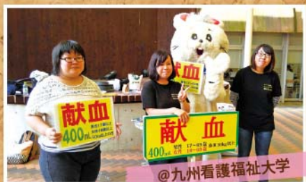
@九州看護福祉大学

昨年10月～今年5月にかけてスナップ写真を撮らせていただいた方々をご紹介します。