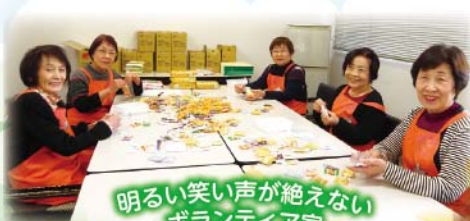
明るい笑いが絶えない ボランティア室

先日(3/6) 久しぶり(7年6ヵ月)に献血しました。無事50回献血をする事が出来ました。60才前日までが献血年齢だと思っていたので、おそろおそろ献血会場に行けると大丈夫という事で、これで献血できる年齢も延長でき、良かったです。