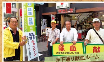
@下通り献血ルーム