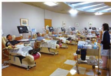
日赤プラザ献血ルーム再開日 多くの方々にご協力をいただきました。

献血を希望される皆様には大変ご心配とご迷惑をお掛けいたしました。日赤プラザ献血ルームは5月10日(火)から、献血バスの運行は5月16日(月)から再開することができました。