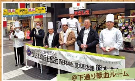
@下通り献血ルーム