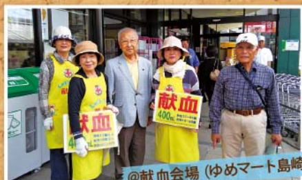
@献血会場 (ゆめマート島崎)