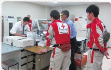
輸血用血液の配送準備 (救護服は他県からの支援要員)