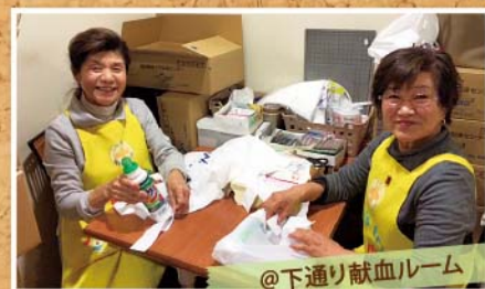
@下通り献血ルーム