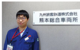
九州旅客鉄道株式会社 熊本総合車両所