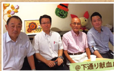
@下通り献血ルーム

「ヒトにやさしいまちづくり」をスローガンに 下通繁栄会の皆様にご協力いただきました！