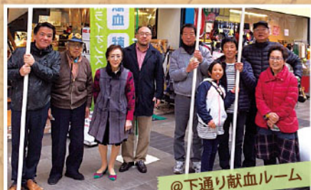
@下通り献血ルーム