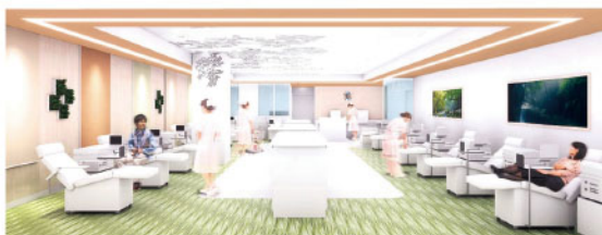
▲採血室は「緑のギャラリー」※写真はイメージ