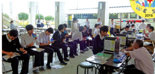
献血受付も生徒で一杯！

創立記念祭で全校生徒・教職員・保護者約1,200名の前でスライドを使っての発表や、献血パネルを展示いただきました。学校献血では生徒保健委員の呼び掛けの甲斐あって、70名(400mL献血)と多くのご協力をいただき、献血記念品として生徒デザインの「2016年創立記念祭デザイン缶バッジ」をプレゼントしました。