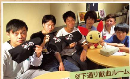
@下通り献血ルーム

献血いただいた方へみかんをプレゼントしました！ 6Z (ゾーン) ライオンズクラブの皆様