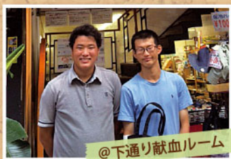
@下通り献血ルーム