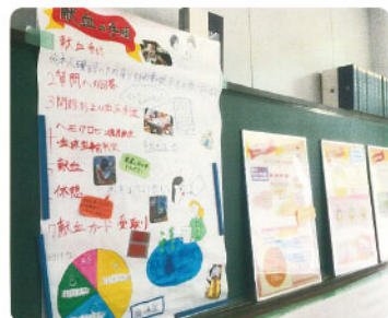
教室内にポスターを展示