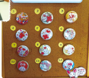
献血記念品 個性が光るデザイン