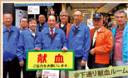
@下通り献血ルーム

献血いただいた方へみかんをプレゼントしました！ 6Z (ゾーン) ライオンズクラブの皆様