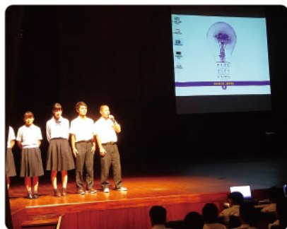
震災の影響で体育館が使用できず、県立劇場で発表