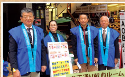
@下通り献血ルーム