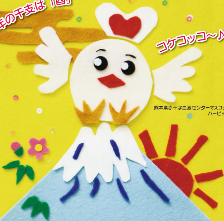
熊本県赤十字血液センターマスコット ハービット