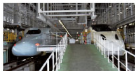
検査庫内に整列する新幹線N700系と800系う〜んカッコイイ!