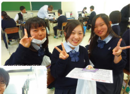
初めての献血でもリラックス

また、学校献血では、美術科の生徒デザインによるオリジナル缶バッジ(全12種)を献血記念品として作製。震災の影響により仮設プレハブでの献血受付でしたが、63名(400mL献血)と多くのご協力をいただきました。