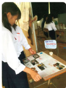
「献血体験記」は、生徒さん目線で解り易く献血を紹介