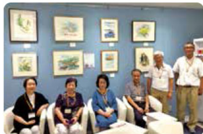
「あすなるの会」の皆さま