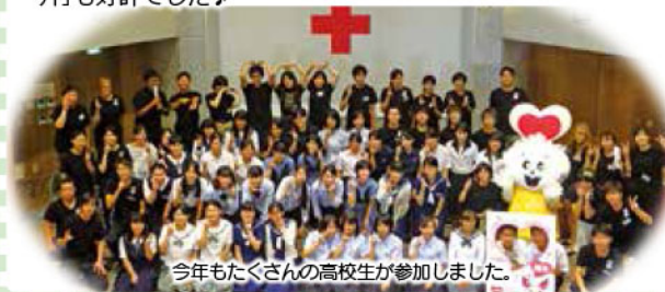
今年もたくさんの方々が参加しました。