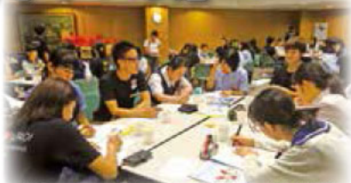
献血のイメージについて大学生と高校生が討論

8月19日、夏休み恒例となりました、高校生を対象とした「血液センターオープンキャンパス」を血液センターにて開催しました。熊本県学生献血推進協議会(県内9大学)の学生ボランティア約30名が講師となり、参加した高校生約40名と、献血クイズやグループディスカッションを通して献血の大切さについて楽しく勉強しました。高校生からは「針が痛そうというイメージがあり献血を敬遠していたが、今度協力したい。」「大学生と楽しみながら献血について知ることができた。周りの人にも伝えて関心を持ってもらいたい。」などの感想をいただきました。お昼ごはんの大学生手料理「焼肉ピビンバ丼」も好評でした♪