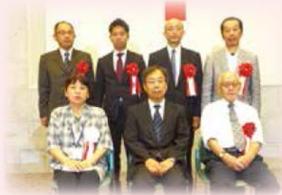
厚生労働大臣表彰状、感謝状の受章者

日本赤十字社では、継続的に献血のご協力をいただいた団体、もしくは献血の推進活動にご功労のあった団体へ感謝の意を表し表彰を行っています。