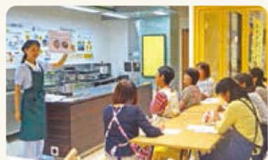
スイーツを焼く間に栄養バランスについて講義