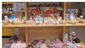
金魚グッズも充実!