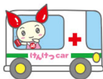
平成28年度 県内における複数回献血状況 (実献血者数)