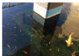
役場にある池の鯉。池で生まれた赤ちゃん鯉がかわいい。

長洲町の水産は360年ほどの歴史があり、稚魚の餌であるミジンコが池や沼に豊富に生息していたことなど養殖に適した環境から、明治時代ごろ大量に生産されるようになったとのこと。町では金魚の他、鯉も生産されていて、14名の養魚組合員が販売、卸を営まれています。金魚すくい選手権がある「火の国長洲金魚まつり(5月)」や金魚品評会がある「金魚と鯉の郷まつり(10月)」、850年の歴史を誇る「的ばかり(的を奪い合う勇壮な裸まつり(1月))」など興味津々のお祭りも多いので、是非、観光してみたいですね。