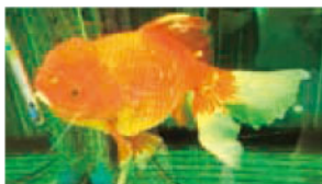
サニーちゃん。大きさにビックリ。