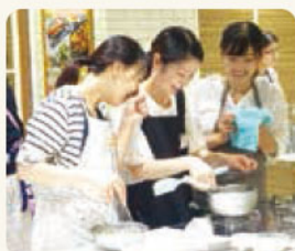
高校生や大学生も多数参加