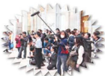
倉野尾さんのまわりはファンや 報道陣で一杯!