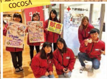
@下通り献血ルーム COCOSA