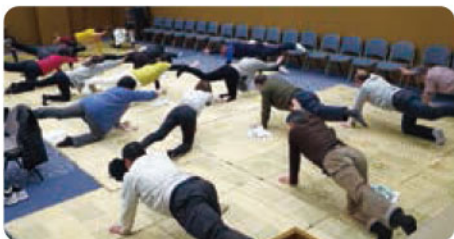
食べたら動く! お手軽ストレッチ♪