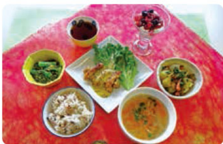
おいしくてヘルシーボリューム満点の日赤健康薬膳

今回、イベントに参加された方はもちろん、残念ながら参加できなかった方も、これからも健康なお体で献血を続けてくださいね♡