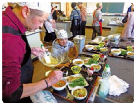
たくさんの方の料理男子にご参加いただきました

食べたら動くということで、午後からは、自宅で手軽に疲労回復ができるストレッチ法などを紹介する実技体験を行いました。