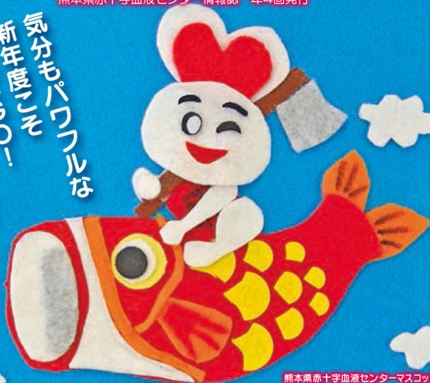
熊本県赤十字血液センターマスコット ハービット