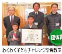
わくわく子どもチャレンジ学習教室