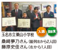
玉名市立築山小学校