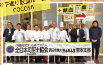
@下通り献血ルーム COCOSA