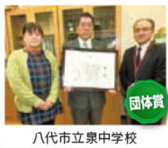
八代市立泉中学校