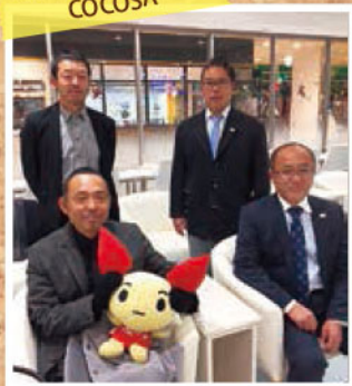
@下通り献血ルーム COCOSA