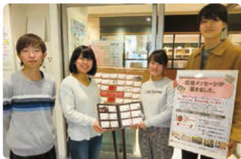
届いたメッセージ

現在、日赤プラザ献血ルームと下通り献血ルームCOCOSAに展示していますので献血に来られた際には是非、お礼のメッセージを書いてください。