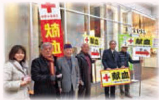
337-E地区1Zライオンスクラブの皆さま

献血バス・献血ルームともに、 ご協力いただいた企業・団体名および ご協力人数を翌日の熊本日日新聞 「献血ありがとう」欄に掲載いたします。