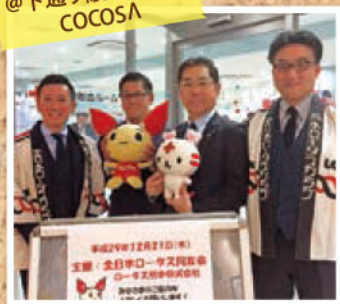
@下通り献血ルーム COCOSA

平日の寒い時期に多くのご協力をいただきました。 全日本ロータス同友会 熊本県支部の皆さま。