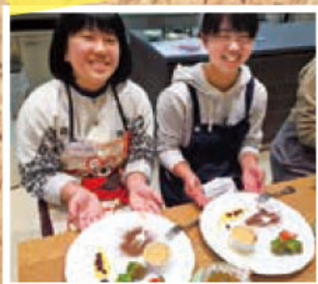
@下通り献血ルーム COCOSA

平日の寒い時期に多くのご協力をいただきました。 全日本ロータス同友会 熊本県支部の皆さま。