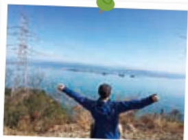
維和島で一番高い山 標高166.9mの「高山」

今回は維和島コースにある維和桜・花公園を歩いてみました。山桜やパール柑畑を眺めながらの遊歩道。展望所は島原の普賢岳、天草五橋、八代市内をぐるっと見渡すことができる