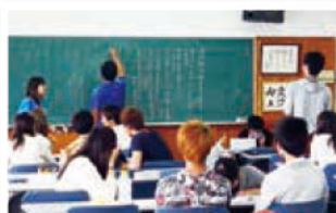
若者の献血者を増やすためには…。 学生の意見が飛び交うディスカッション。