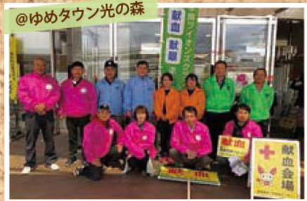
@ゆめタウン光の森

ゴールデンウィークの献血にご協力いただきました。 ライオンズクラブ国際協会337-E地区4Zの皆さま