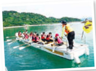
カッター船の講習やバーベキューで学生同士の連携をUP!