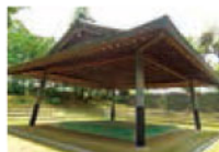
城内の公園と相撲場