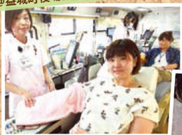
@益城町役場仮設庁舎