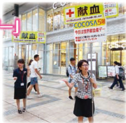
下通り献血ルームが入るCOCOSAビル前で 献血呼び掛け。

この記念日は、血液という「いのちを救う贈り物」をご提供いただく献血者の皆さまに感謝し、輸血用血液を必要とする患者さんのために献血が欠かせないことを知ってもらう日です。当日は、街頭やラジオで献血を呼び掛け、献血にご協力いただいた方へ感謝の気持ちを込めて「栄養ドリンク」をプレゼントいたしました。これからも、より多くの方が「助け合い」の心を持って献血に足を運んでいただけることを願っています!