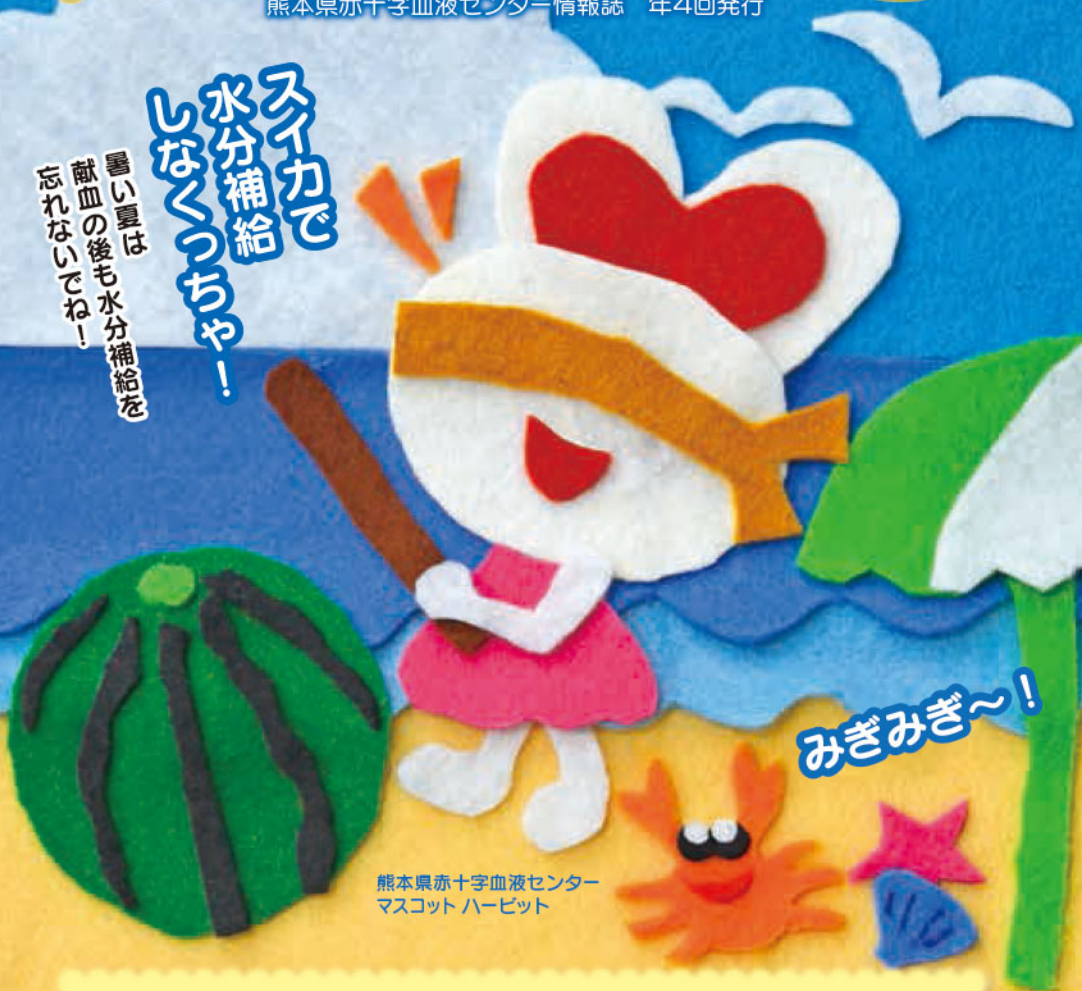
熊本県赤十字血液センター マスコット ハービット

スイカで 水分補給 しなくっちゃー！ 暑い夏は 献血の後も水分補給を 忘れないでね！