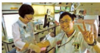
献血ベテラン、笑顔でポーズ！

「献血にご協力いただいた社員の年齢層や、協力者が少ない受付時間帯などをサークルで分析し、協力体制をより良くしたい。」と、さらなる向上心を持っています。私たち血液センタースタッフも頭が下がる思いです！