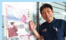
日本全国の献血ルームを周るのが夢!