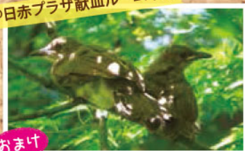
@日赤プラザ献血ルーム中庭

ナイストライで献血の仕事について 勉強しました。 錦ヶ丘中学校の生徒さん。 高校生になったら献血してネ!