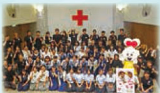
昨年のオープンキャンパスの様子