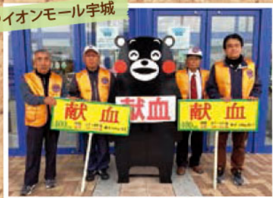
@イオンモール宇城

ゴールデンウィークの献血にご協力いただきました。 ライオンズクラブ国際協会337-E地区4Zの皆さま