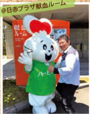
全国の献血ルームを周るのが夢！ 応援しています！