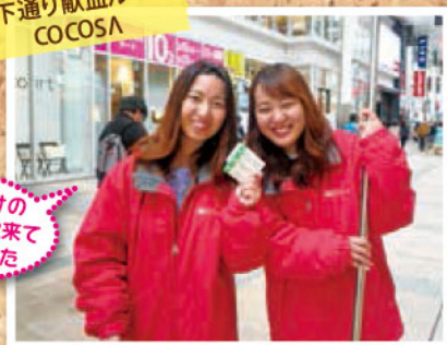
九州ルーテル学院大学の学生さん