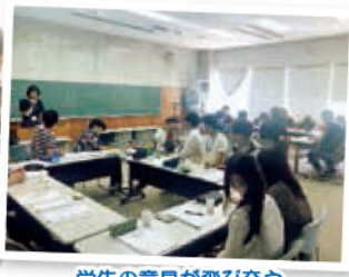
学生の意見が飛び交う ディスカッション。