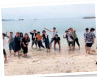
芦北の海とバーベキューで連帯感UP!