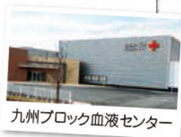
九州ブロック血液センター