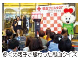
多くの親子で賑わった献血クイズ

このようなイベントを通して、「人助け」の精神が少しずつでも広がり、献血者の増加に繋がればと願います。