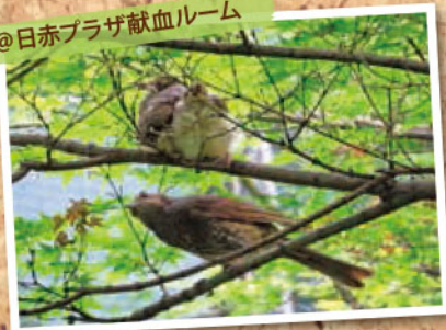
毎年中庭にヒヨドリが巣をつくります。 飛び方を教えているみたいです。