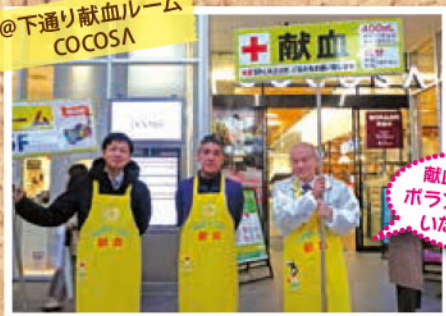
熊本県生コンクリート工業組合の皆さん