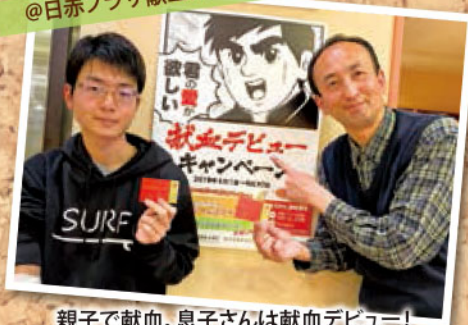
親子で献血。息子さんは献血デビュー！