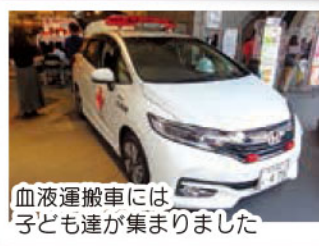
血液運搬車には子ども達が集まりました