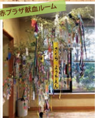
毎年、さくら幼稚園の子ども達が 造ってくれます。