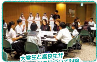
大学生と高校生が 献血について討論。