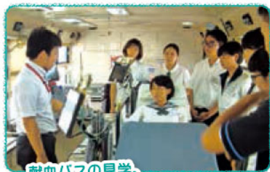
献血バスの見学。 献血をイメージできたかな？

8月17日、高校生が献血について学ぶ、「血液センターオープンキャンパス」を血液センターにて開催しました。熊本県学生献血推進協議会（県内9大学）の学生ボランティアが講師となり、高校生43名（15校）が、施設見学（血液保管庫、献血バス）やディスカッションを通して、献血の大切さについて楽しく勉強しました。参加者からは、「学校でも授業の一環として献血を取り上げてはどうか」、「SNSを上手く活用して若者に献血を広められないか」などの意見が挙がりました。今回学んだことを、ご家族や学校のお友だちなどにも是非伝えていただき、若者から献血の輪を広げていただければと思います！