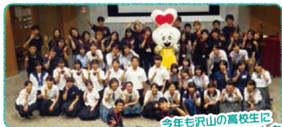
今年も沢山の高校生に 参加していただきました！