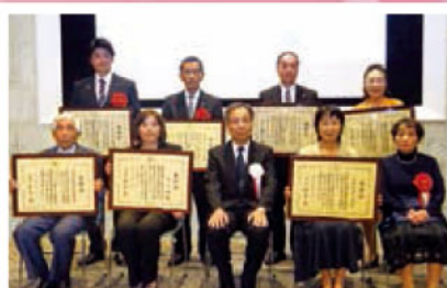
厚生労働大臣表彰状、感謝状の受賞者

日本赤十字社では、継続的に献血のご協力をいただいた団体、もしくは献血の推進活動にご功労のあった団体へ感謝の意を表し表彰を行っています