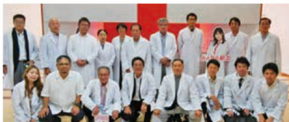
ライオンズクラブの皆さま