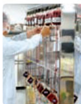
白血球除去の様子

輸血用の血液は、血液の成分(赤血球、血漿、血小板)ごとに分けて造られます。これは患者さんによって必要な血液成分が異なるためです。血液は遠心機や特殊な機械で成分ごとに分離されます。また、輸血による副作用の原因を除去するため