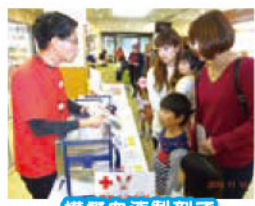
模擬血液製剤で 保管方法などを説明