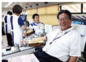
満面の笑顔で献血。永里社長。