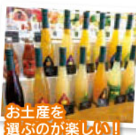
お土産を 選ぶのが楽しい!

異国情緒漂う福田農場で、目の前に広がる海を眺めながらゆったりとした時間を過ごしませんか?当施設では、地元食材をふんだんに使った看板メニューパエリア、農場オリジナルクラフトビールや農園で採れた甘夏などを使用したフルーツワイン「サングリア」を堪能できます。また、パエリアやパン作りなどの体験コーナーや、フラメンコショー(日曜日2回公演)もあって、友人やご家族と一緒に楽しめます!柑橘類のジュース、ジャム、ソースに調味料などお土産も豊富に揃っていますよ。是非、立ち寄ってみたいですね。