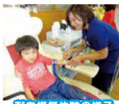
献血模擬体験の様子。 少し緊張気味?