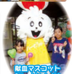
献血マスコット 「ハービット」は 子ども達に大人気!