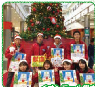
イオンモール熊本