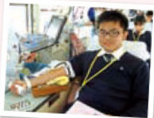
生徒さん達の目が輝いています!