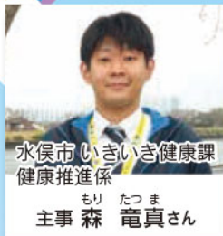
水俣市 いきいき健康課 健康推進係