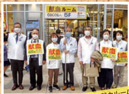
熊本キャッスル ライオンズクラブの皆様