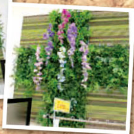
季節に合わせて 献血ルーム内の 飾りをアレンジしています。(5月撮影)