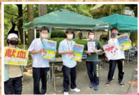
体育会の学生さんに 呼びかけを行っていただきました!