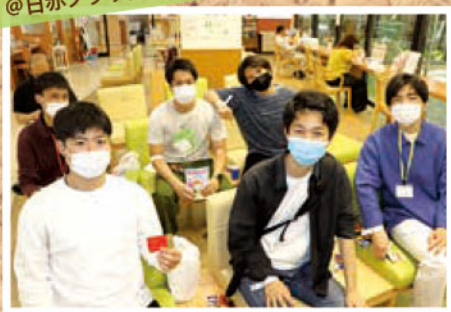
「献血サークルつくります！」 熊本県立大学の学生さん