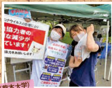
@献血バス(熊本大学)