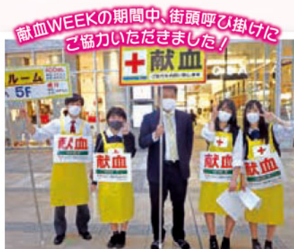
熊本中央高校の先生と生徒の皆さん。 ありがとうございました。