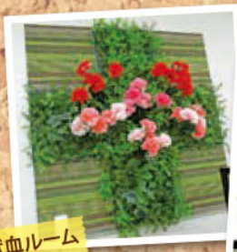
@下通り献血ルーム COCOSA