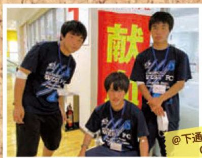
部活帰り?に献血にご協力いただきました! 熊本西高校サッカー部の皆様