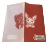
マルチケース マスク保管・ チケット入れ として