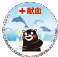
7月(イルカウォッチング)