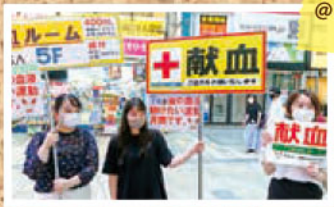
@下通り献血ルーム COCOSA

7月「愛の血液 助け合い運動」を 呼びかけました。 県学生献血推進 協議会の学生さん