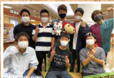
@日赤プラザ 献血ルーム

熊本県立大学 ラグビー部の皆さん 元気いっぱい! チームメイトの皆さんで献血ご協力でした★