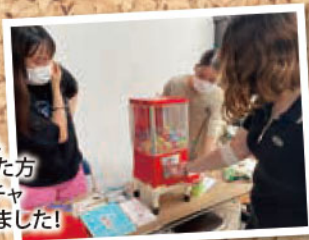
@献血バス(7/12) 熊本保健科学大学

熊本保健科学 大学の皆さん 「学友会」主催で、 献血ご協力頂いた方 限定の方チャガチャ 抽選会が行われました!