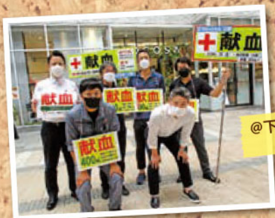
@下通り献血ルーム COCOSA

毎年、夏と冬に呼び掛け&献血のご協力を いただいています。 熊本県生コンクリート工業組合の皆様