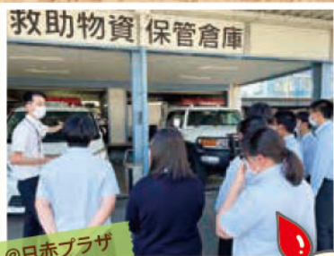
@日赤プラザ 献血ルーム