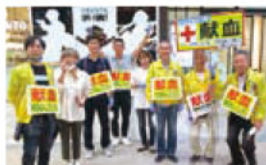
ライオンズクラブ国際協会 337-E地区1Zの皆様

献血ルームでのご協力は、1日または期間を設けて、日赤プラザ献血ルームもしくは下通り献血ルームCOCOSΛにお越しいただき、ご協力をお願いします。(少人数可)また、下通献血ルームCOCOSΛ前(下通アーケード)での呼びかけボランティアにご協力いただける企業・団体も募集しています。