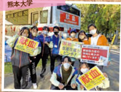
@献血バス(10/18,19) 熊本大学

熊本大学(10/18,19)体育会の皆さんが 学生さんに協力を呼びかけてくれました(^^)/ 2日間で135名のご協力をいただきました!