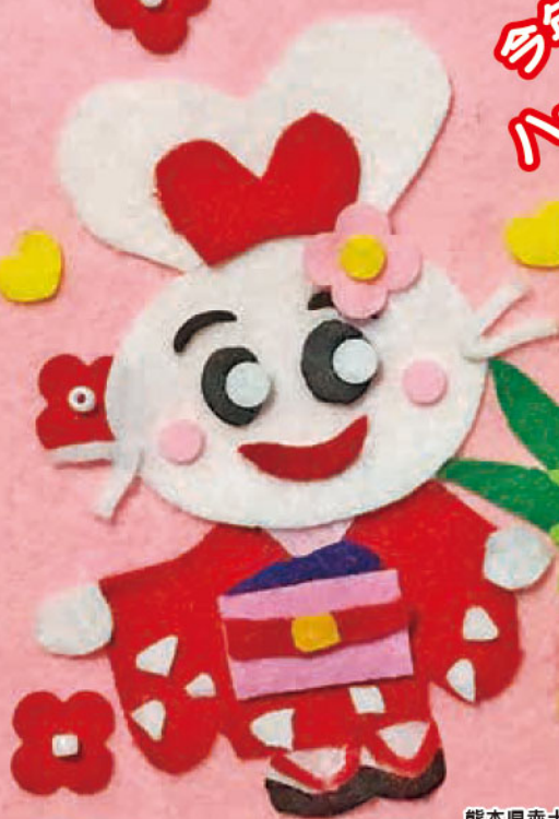
熊本県赤十字血液センター マスコットハービット