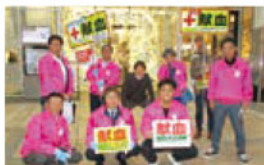
熊本第一 ライオンズクラブの皆様