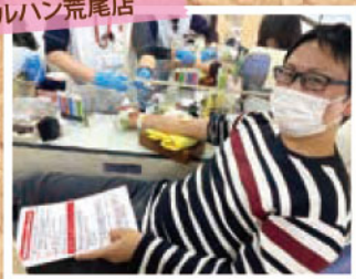
@献血バス(12/15) マルハン荒尾店

マルハン荒尾店(12/15)にて、 関係者の皆さま含め、多くの方へ ご協力をいただきました(^^♪)