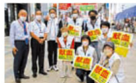
熊本キャッスル ライオンズクラブの皆様

【献血実施後】ご協力いただいた企業、団体名及びご協力人数を、後日、熊本日日新聞「献血ありがとう」欄に掲載させていただきます。