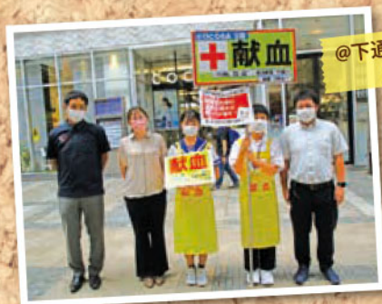
@下通り献血ルーム COCOSA