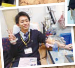
熊本第一ライオンズクラブ様 生徒さんにパンの 提供ありがとうございました!