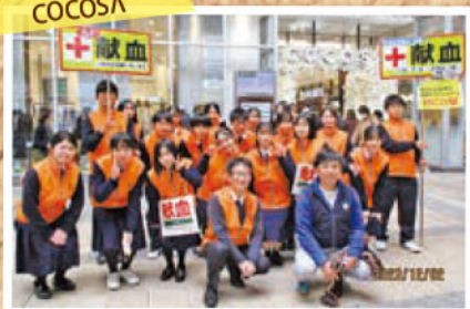
熊本葵ライオンズクラブと親和葵レオクラブの皆様