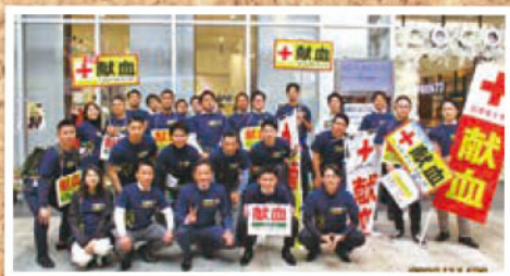
プルデンシャル生命保険の皆様 とてもパワフルな呼び掛けでした!