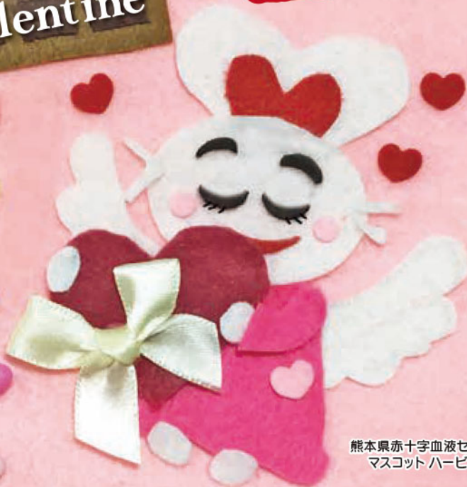
熊本県赤十字血液センター マスコット ハービット