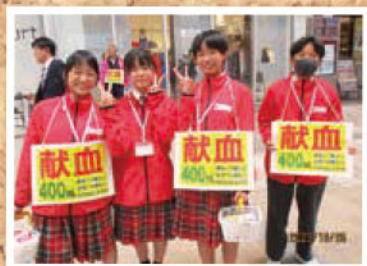
熊本マリスト学園中学校の生徒さん ナイスライ(職場体験)で、 献血について学びました!