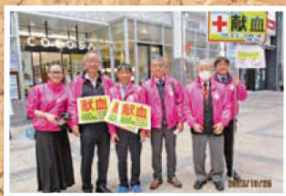
熊本第一ライオンズクラブの皆様