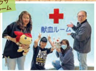
TSMC関係者の皆様 「また来ます!」