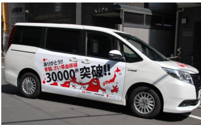
移植症例数3万例突破を日本全国に伝えます

キャラバンカーは、2015年4月24日、沖縄県知事出席のもと行われる出発式を皮切りに、約2ヵ月をかけてすべての都道府県をめぐる。各都道府県では、キャラバンカーが赤十字血液センターを訪問するほか、献血会場での骨髄バンクドナー登録会など、骨髄バンク・さい帯血バンクをアピールするため、趣向を凝らしたイベントを企画しています。