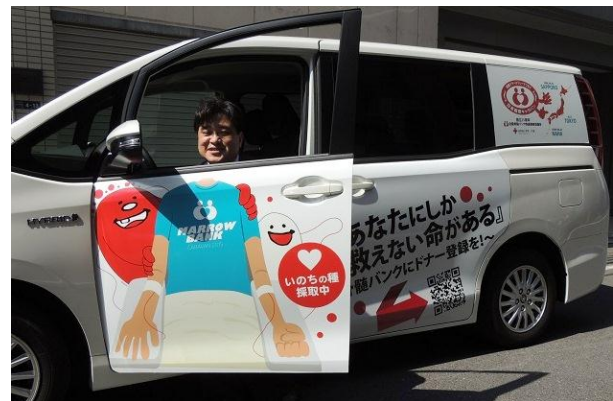
助手席には末梢血幹細胞採取中のイラストが!