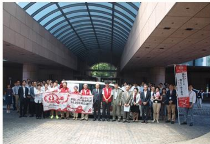
6/1 東京 日赤本社で歓迎セレモニー キャラバンカーのうしろにも人がいっぱい！！