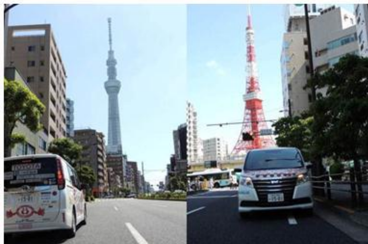
5/30 東京 新旧日本一！ スカイツリーと東京タワー