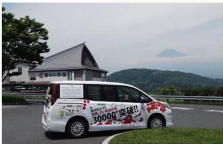
5/28 静岡 こちらも日本一！ 富士山を望むキャラバンカー