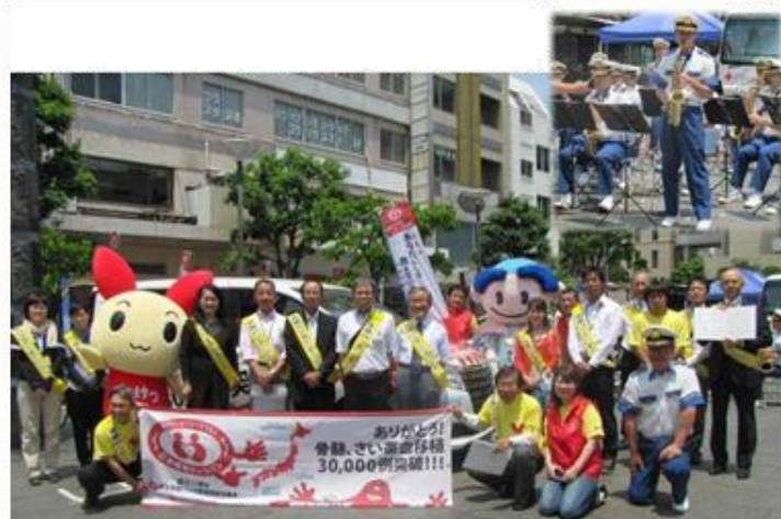
5/28 静岡 静岡のたけちよくと一緒にパチリ 音楽隊が演奏で花を添えます♪