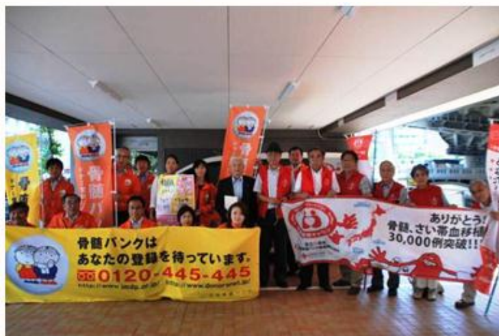
6/1 東京 日本骨髄バンクでも大歓迎