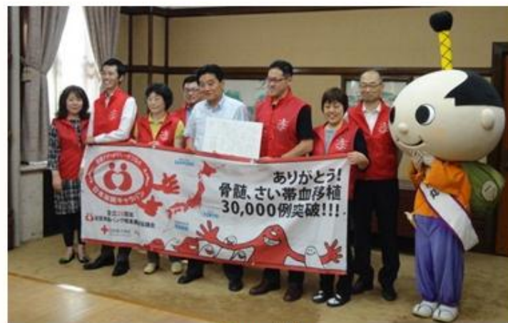
5/26 愛知 河村名古屋市長とはち丸君 市長は「骨髄バンクを支援する若手国会議員の会」の主要メンバーでした