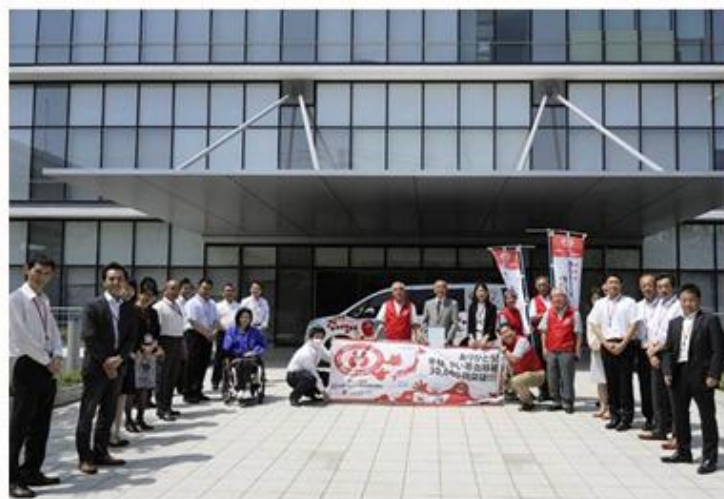
6/1 東京 日赤関東甲信越ブロックと東京都センターで お出迎え

このあと、キャラバンカーは整備のために東の間の休憩タイムへ(^^)/★ 沖縄から38日目、走行距離は5,231km！6月28日・北海道のゴールを目指して、キャラバンカーの旅は続きます。