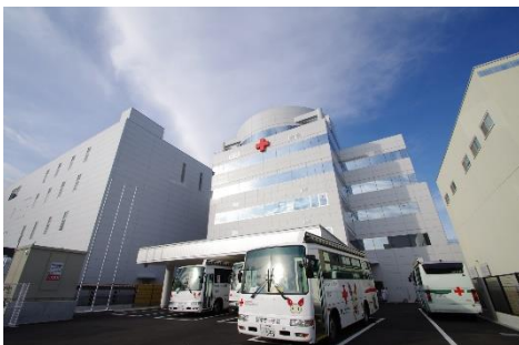
京都府赤十字血液センター