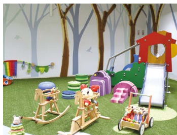
うまキッズルーム