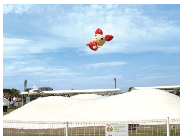
うまキッズひろばの“くものじゅうたん”