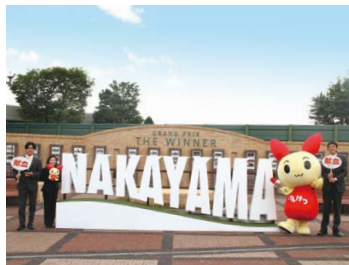
グランプリガーデン