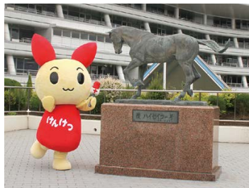
ハイセイコー号馬像

A JRA全体の取り組みとして、貴重な休日にご来場いただくすべてのお客様に楽しんでいただくことを第一に考えています。特に、お子様やそのご家族、競馬に触れたことのない方々でも楽しめる施設やイベントをご用意しています。単に賭け事(ギャンブル)という面ではなく、国際的なスポーツエンターテインメントとしての魅力があります。「レースの迫力」、「馬の美しさ」をぜひ競馬場で体感していただければと思います。