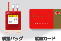
機器バッグ 献血カード