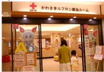
①予約後、献血ルームへ