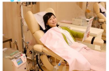
④献血後、お子様をお迎え