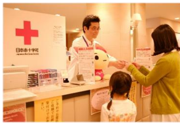
②献血・サービス受付