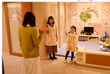
③お子様はキッズスペースへ