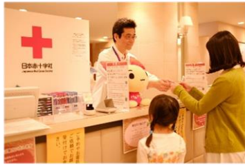
②献血・サービス受付