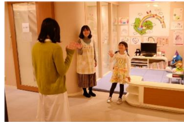
③お子様はキッズスペースへ