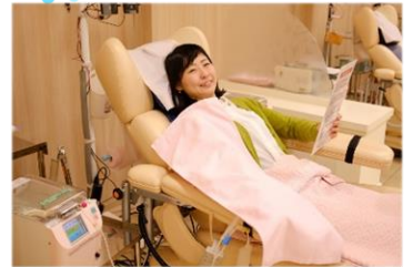
④献血後、お子様をお迎え