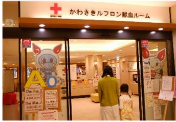
①予約後、献血ルームへ