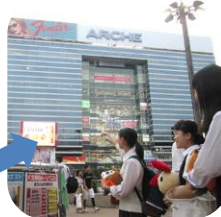
さあ献血ルームは アルシェの向こう☆