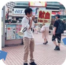
献血お兄さん発見(笑)