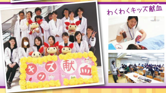
わくわくキッズ献血

私たちは、献血セミナーでの周知活動や街頭での呼びかけを行っています。また、子供向けの献血模擬体験イベント“キッズ献血”を行い、幼稚園・小学生のころから献血に慣れ親しんでもらう活動を行っています。