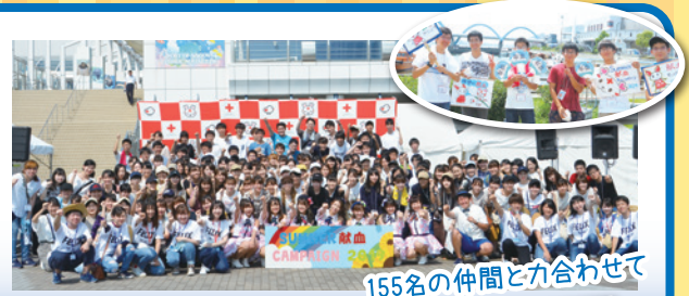
155名の仲間と力合わせて

愛知県学生献血連盟Aichi Goは若年層の献血者の増加を目標として年3回献血キャンペーンを行い献血啓発に努めています。年々キャンペーン内の献血者数は増加しているので、この波に乗って多くの貢献ができればいいなと思っています。