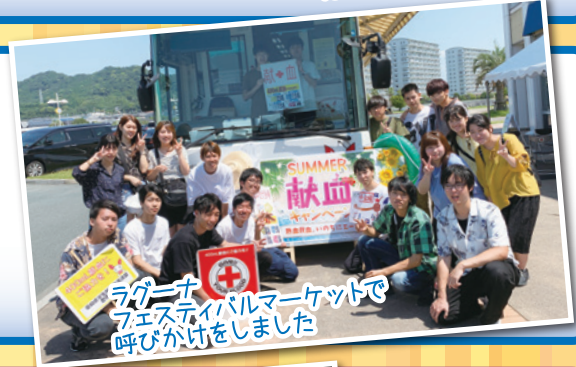
ラグーナフェスティバルマーケットで呼びかけをしました

愛知県学生献血連盟豊橋支部は若年層献血者の増加のため、年2回献血活動を行なっています。夏のキャンペーンでは昨年と比べ献血者が減少してしまったので、冬のキャンペーンに向け、減少理由を分析し、昨年以上の献血者数を目指しています。