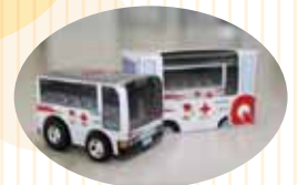
参加賞：献血バス型チョコQ