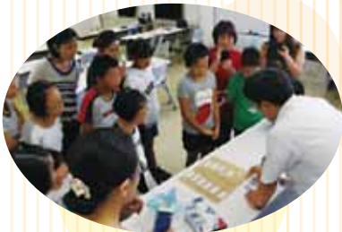
血液細胞を観察しよう！