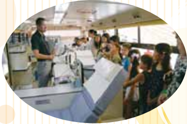
献血バスや緊急車の乗車体験！