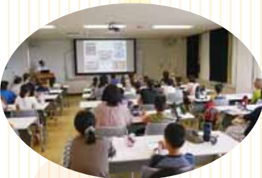
献血のいろんなお話が聞けるよ！