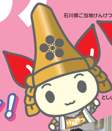
石川県ご当地けんけつちゃん